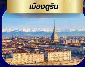
เมืองตูริน

เที่ยว 3 ประเทศ ฝรั่งเศส สวิตเซอร์แลนด์ อิตาลี เส้นทางยุโรปยอดนิยม ปารีส หอไอเฟล ประตูชัย พิพิธภัณฑ์ลูฟร์ ล่องเรือบาโตมูช ชมวิวปารีสบนสายน้ำ เจนีวา นาฬิกาดอกไม้ น้ำพุเจดโด้ เมืองโลซานน์ ศาลาไทยแห่งเมืองโลซานน์ เมืองเซอร์แมท หมู่บ้านโรัดยนต์ ชมวิวยอดเขาแมทเธอร์ฮอร์น เมืองซียง เมืองตูริน มหาวิหารตูริน เมืองมิลาน ดูโอโมแห่งเมืองมิลาน ช้อปปิ้ง SERRAVALLE OUTLET