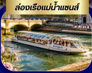
ล่องเรือแม่น้ำแซนส์